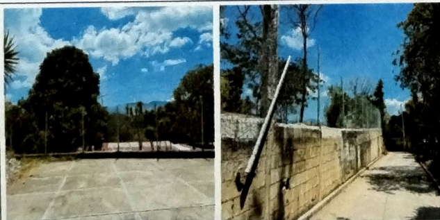
Foto 11: TRABAJOS EXTERIORES Vista de muro perimetral a base de bloc y malla metalica