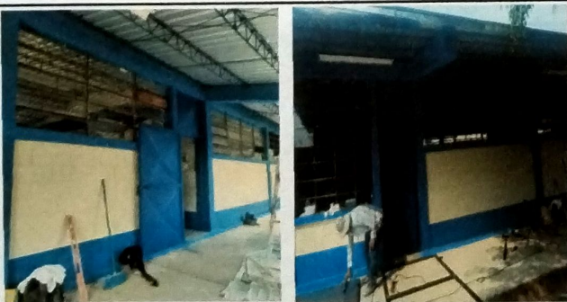
Foto 5: MODULO A Vista de mantenimiento a puertas de metal de aulas.