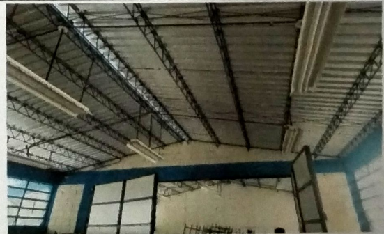
Foto 6: MODULO A Vista interior de aula con mantenimiento de estructura a base de Joist y cubierta de lamina troquelada cal 26.