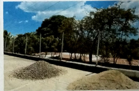
Foto 12: TRABAJOS EXTERIORES Vista de muro perimetral a base de bloc y malla metalica