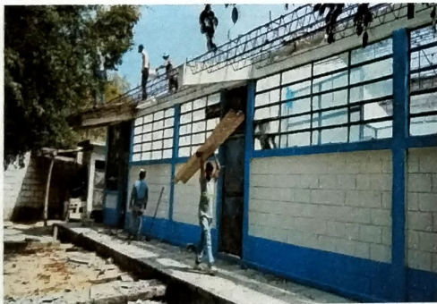
Foto 3: MODULO A vista de estructura ya con cubierta de asebesto desmontada.