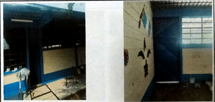
Foto 4: MODULO A Vista de mantenimiento a puertas de metal de aulas.