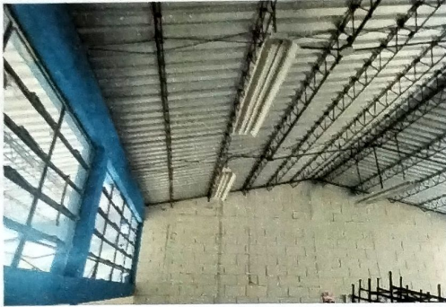
Foto 7: MODULO A Vista interior de aula donde se dio mantenimiento a estructura de metal a base de Joist.