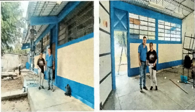
Foto1: Vista con Directora del plantel escolar