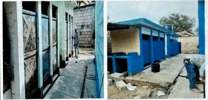
Foto 8: MODULO SERVICIOS SANITARIOS mantenimiento de puertas de metal y pintura de modulo.